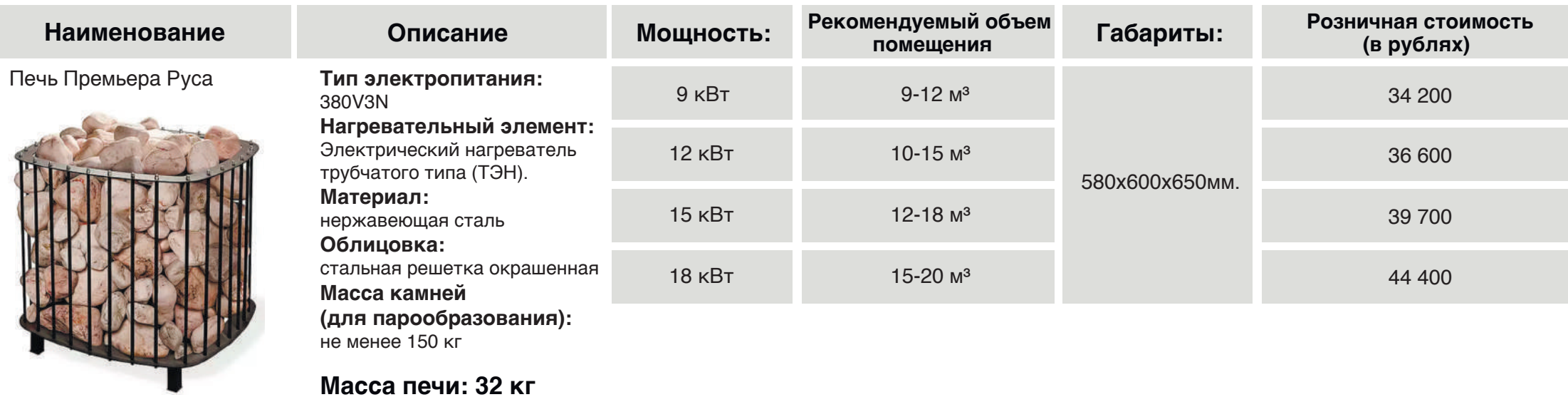
Печь Премьера М